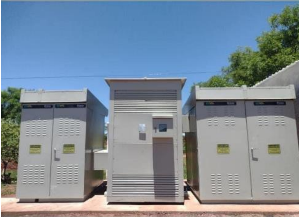
Cliente SABESP PMT + TRAFOS A SECO MT + QGBT + Trafo Aux. UFV Euclides da Cunha/SP