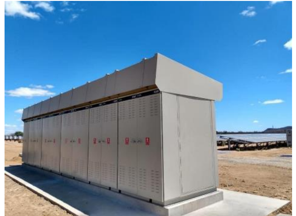
Cliente ENEL X / Concessionária: Neoenergia 4 Medições Compartilhadas UFV - PETROLINA/PE