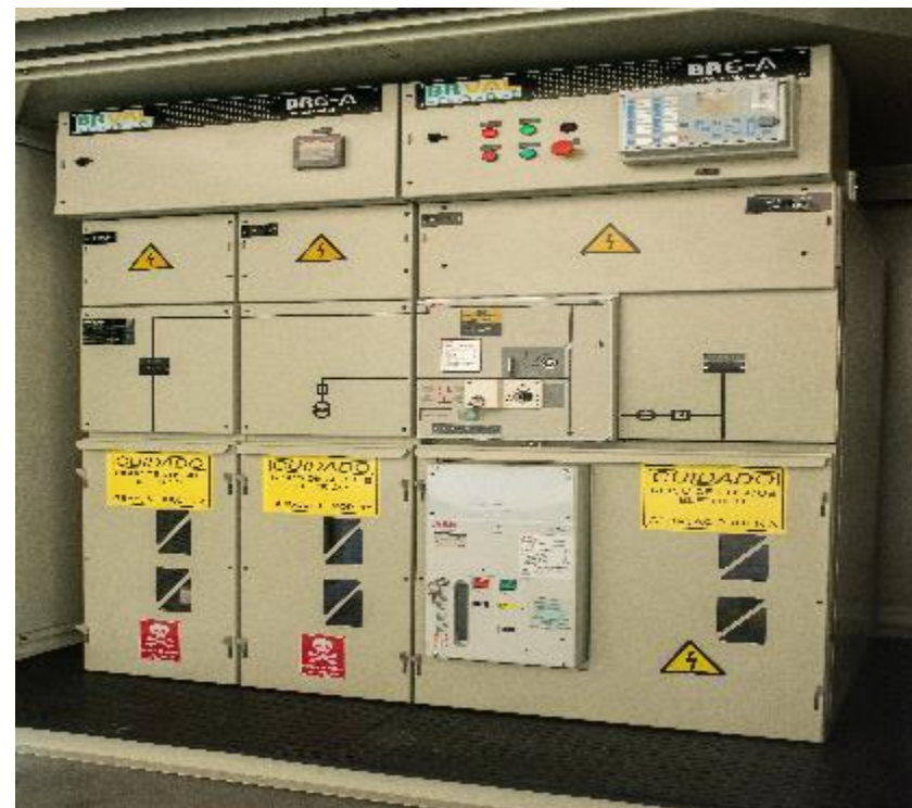
Vista Interna em Fábrica Cliente: Green Yellow Local da obra: CEARÁ – UFV Cedro