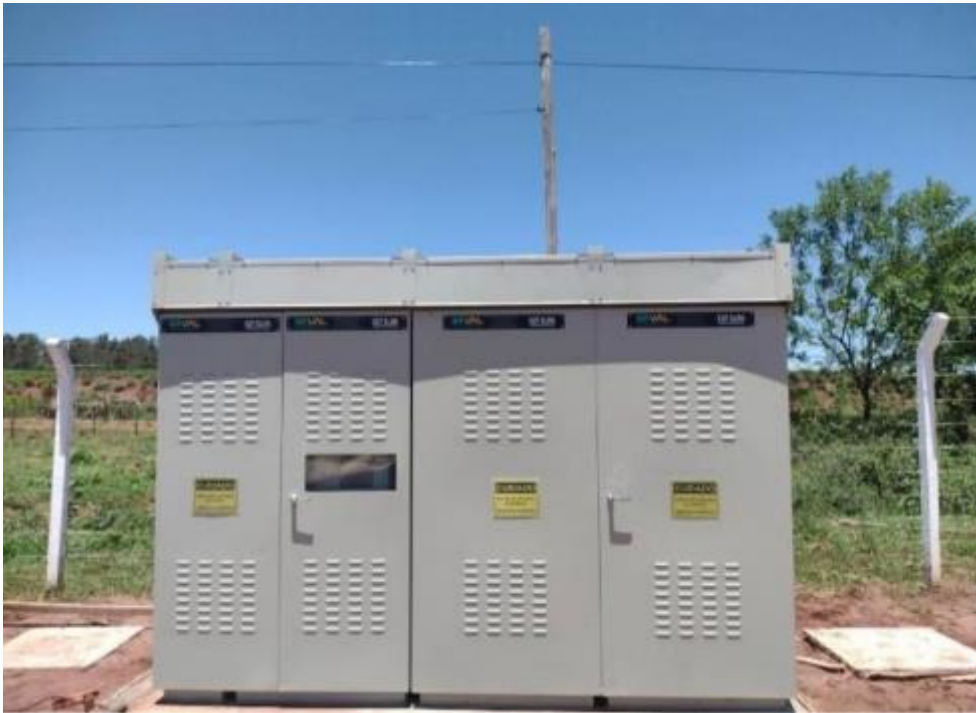
Cliente SABESP / Concessionária: ELEKTRO 1 Medição UFV Euclides da Cunha/SP