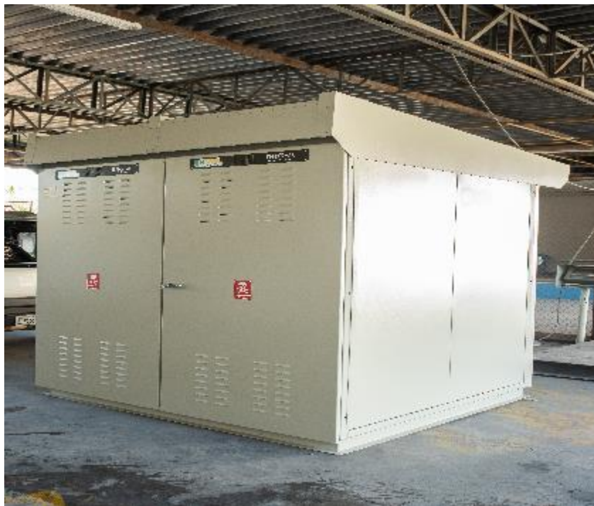
Vista Externa em Fábrica Cliente: Green Yellow Local da obra: CEARÁ – UFV Cedro