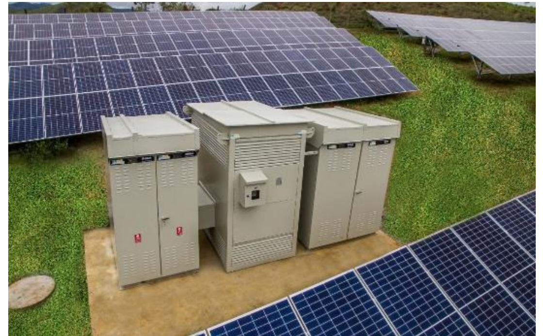
Cliente Solarian PMT + TRAFOS A SECO MT + QGBT + Trafo Aux. UFV - Rio das Flores/RJ